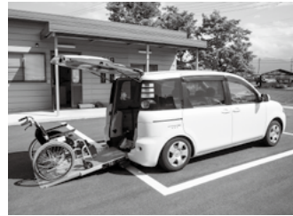
▲写真はシエンタです。